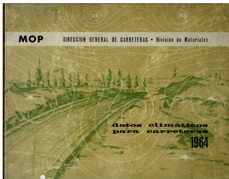
Figura 1: Portada de la publicación Datos Climáticos para Carreteras[1]

El método que se va a describir a continuación fue elaborado en 1964 por la Dirección General de Carreteras del entonces Ministerio de Obras Públicas[1]. En esta publicación se describe una metodología para la obtención de coeficientes correctores de las duraciones de las actividades típicas de la construcción de carreteras que suelen tener largas duraciones, al tiempo que proporciona unos mapas de isóneas con datos de precipitación, temperatura e insolación, así como otros con los coeficientes ya obtenidos (figura 1).