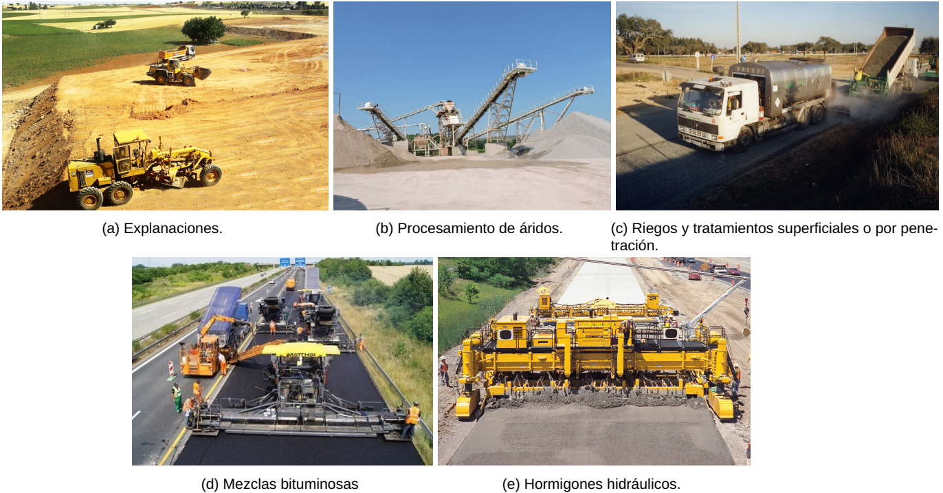
Figura 2: Actividades sujetas a correcciones de programación por inclemencia meteorológica.